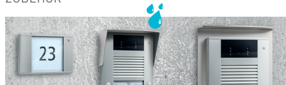
Infefeldmodul Wetterschutzdach Montageplatte (auf Anfrage)

Infefeldmodul, Wetterschutzdach oder Montageplatte einfach montiert Im Format 90 x 135 x 20 mm kann das hinterleuchtete Infefeldmodul im Design der Außenstation bündig anschließend oder auch abgesetzt auf Putz platziert werden. Das Wetterschutzdach wird als Zubehör klebend auf der Außenstation angebracht. Die Montageplatte zur Aufputzmontage von Außenstationen auf unebenem Untergrund ist auf Anfrage in individueller Länge erhältlich.