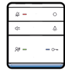
Abb. 1: Anschluss, Beispiel ISW5010